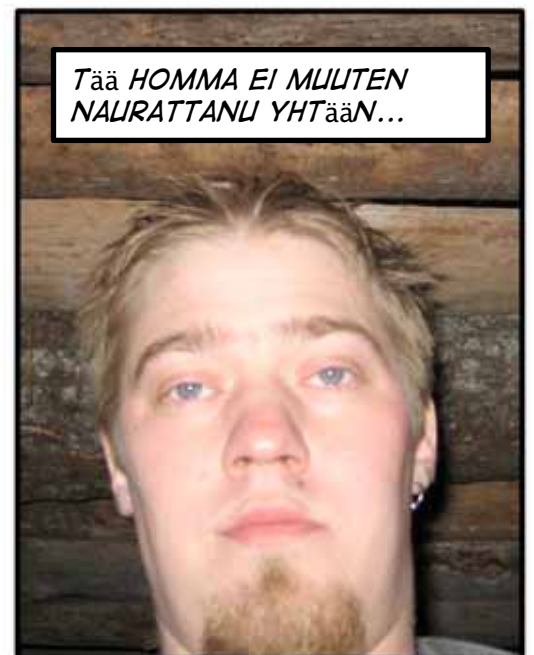
Tää HOMMA EI MUUTEN NAURATTANU YHTÄÄN...