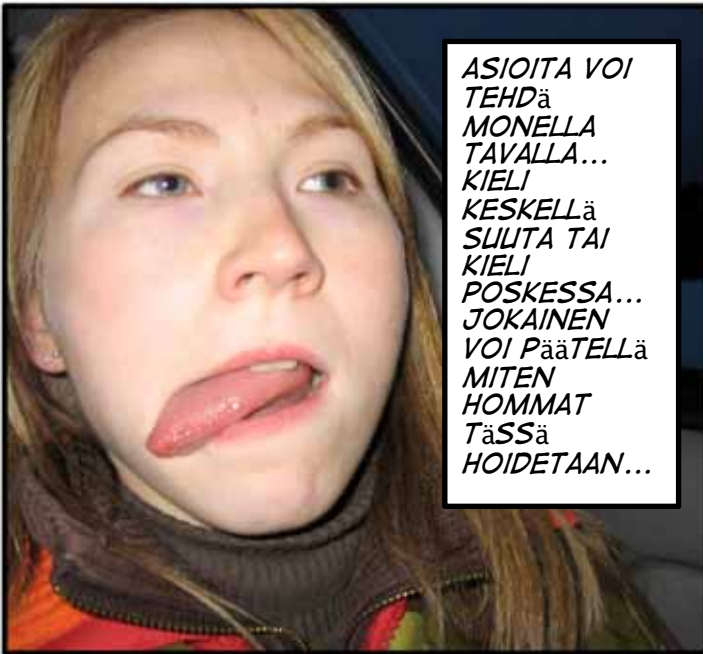
ASIOITA VOI TEHDä MONELLA TAVALLA... KIELI KESKELLä SUUTA TAI KIELI POSKESSA... JOKAINEN VOI PääTELLä MITEN HOMMAT TäSSä HOIDETAAN...