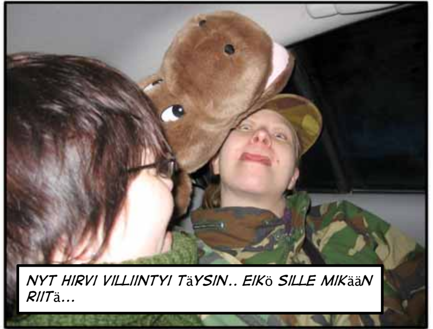
NYT HIRVI VILLIINTYI TäYSIN.. EIKö SILLE MIKään RIITä...