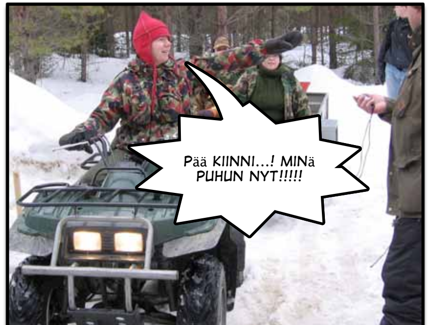
Pää KIINNI...! MINä PUHUN NYT!!!!