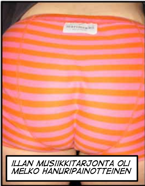
ILLAN MUSIIKKITARJONTA OLI MELKO HANURIPAINOTTEINEN