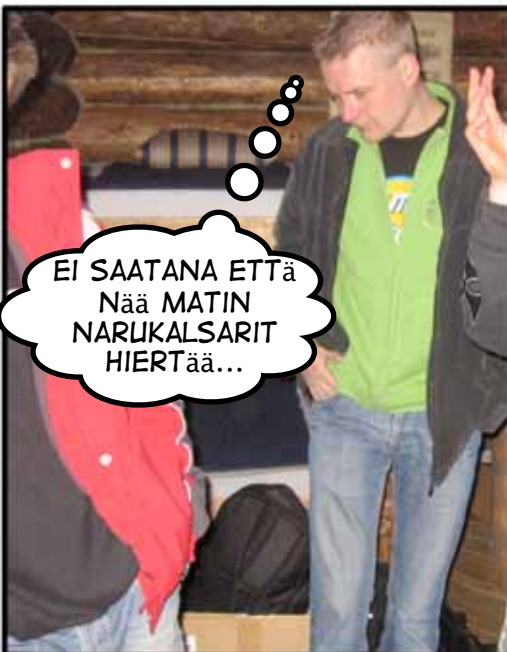
EI SAATANA ETTä Nää MATIN NARUKALSARIT HIERTää...