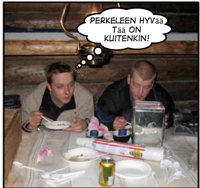
PERKELEEN HYVÄÄ Tää ON KUITENKIN!