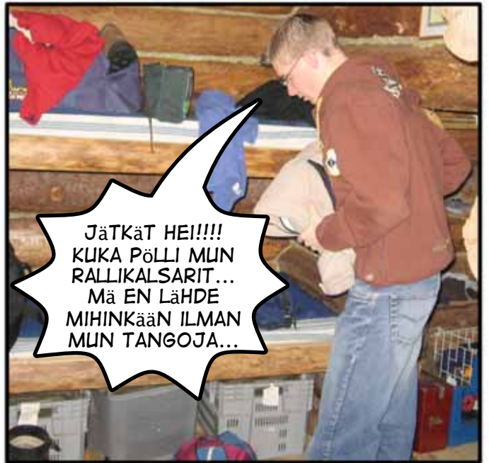
JäTKäT HEI!!!! KUKA PÖLLI MUN RALLIKALSARIT... Mä EN LähDE MIHINKään ILMAN MUN TANGOJA...