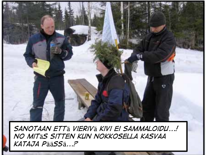
SANOTAAN ETTÄ VIERIVÄ KIVI EI SAMMALOIDU...! NO MITÄS SITTEN KUN NOKKOSELLA KASVAA KATAJA PääSSä...?