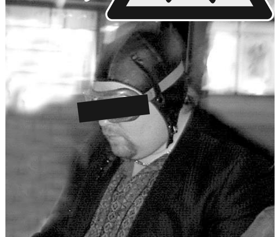
Kyllä vetää hiljaiseksi... Voi vain arvailla mitä nahkakupyrän sisällä liikkuu. Juu... aivan... Ei mitään!

ei käytännössä ollut... Kun muut lähtivät kylille tyttöjä katsomaan niin meikä-läinen meni jokkisautoon seläilemaan tyttökalentoria. Ja jos muut pääsi joskus sormella kokeilemaan niin minulla oli kädet rasvassa jossain koneen reiässä.