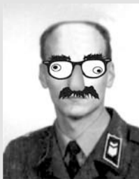
Teamin tiedottaja Lehden päissäantoimittaja e.v.p., nimim. "Viaton huoltomies"

Kävin tässä syksyllä ihan pelkästään katsojan ominaisuudessa katsomassa jokkiskisaa. Ennenhän meitä katsojia oli aina isompi porukka mukana (kuskit mukaan lukien). Ja mitä ihmettä...?? Ei ainuttakaan humalasta huoltomiestä...?? Ei ainuttakaan punasilmäistä kuskia...?? Eikä kukaan huudellu toisilleen mitään asiattomuuksia...?? MIHIN TÄMÄ TOUHU ON OIKEIN MENNYT? Katsomossakaan ei ollut enää mitään jännitystä siitä mitä seuraavaksi tapahtuu. Kaikki ajoi nästisi kilpaa ja hyvä etteivät halanneet kisan jälkeen... Ei mitään yrittystä. Helkutin takamoottoriryssäpaskat teki radalla mitä huvitti eikä kukaan töninyt niitä hevon kuuseen... Ja sen lisäksi käynyt vielä varikolla haukkumassa ne siihen malliin ettei ne enää uskaltanu radalle kuin tavarat housuissa... No yksi asia ei ollut muuttunut... Ajohaalarit oli edelleen sen näköisiä kuin niitä olis käytetty rotanpyydyksinä.