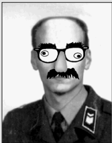
Teamin tiedottaja, lehden päätoimittaja, e.v.p., nimim. "Viaton huoltomies"

Eikä vahvasti mene muutenkaan. Kaksi tiimin perustörppöä on joutunut naimisiin... NAISEN KANSSA. Yäk! Tässä menee aivan sanattomaksi. Tiedättekös muuten miksikä sanotaan kotihommat osaavaa lammasta.... No tietysti uhkaksi naisille.