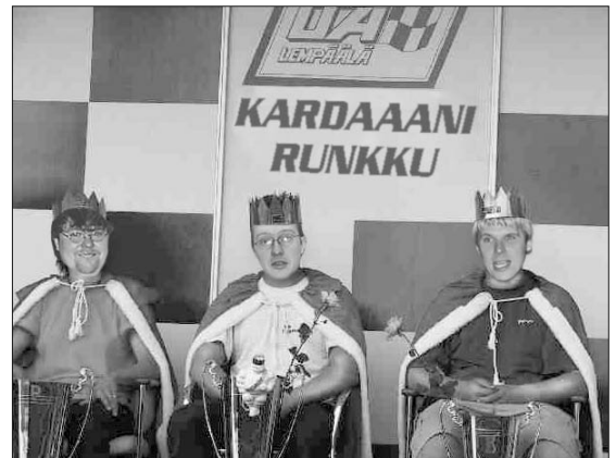
Voittajien on helppo hymyillä. “Ranteet lukkoon ja nimi lehteen” oli tiimin motto voitokkaassa kisassa.